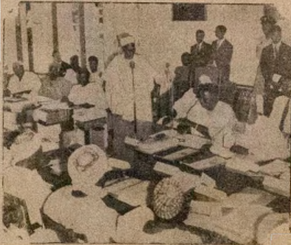
TAFAWA BALEWA LO SE ALAGA NIBI IPADE AWON OLOTU IPINLE METETA NAIJIRIA NI ILU IBADAN.

O ni ki awon akeko na sora ki awon Oselu ti ko bikita fun irepo ma, to won si ona ti ko ye.